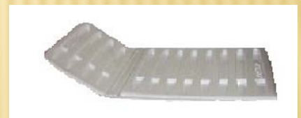
Plan de couchage en thermoformé