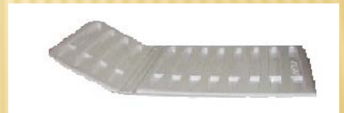
Plan de couchage en thermoformé

Siege social : Z.I LES ZOUINES BABA ALI ALGER Tel : 023 57 01 77/76, fax : 023 57 01 37 Service commercial 0555 90 10 16 / 23 Mail : comet_medical@hotmail.com facebook : comte médical